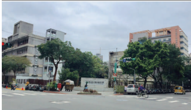
第二文教大樓視覺模擬圖